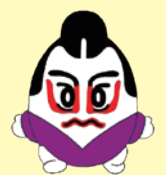
琴平町 マスコトチキャラクター こんぴーくん

本実証運行は環境省による「IoT技術等を活用したグリーンスマートモビリティの効果的導入実証事業」の一環として行つたものです。 ・乗車定員10名（運転手含む）です。 ・満員の場合は次の便までお待ちください。 ・窓から手や頭などを出さないでください。 ・荒天や検査などで急きょ運休する場合があります。 ・アンケート調査を行っています。ご協力をお願いします。 ご協力をお願いいたします。