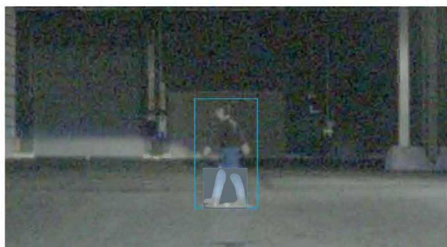
夜間歩行者の認識性能イメージ Recognizing a pedestrian at night