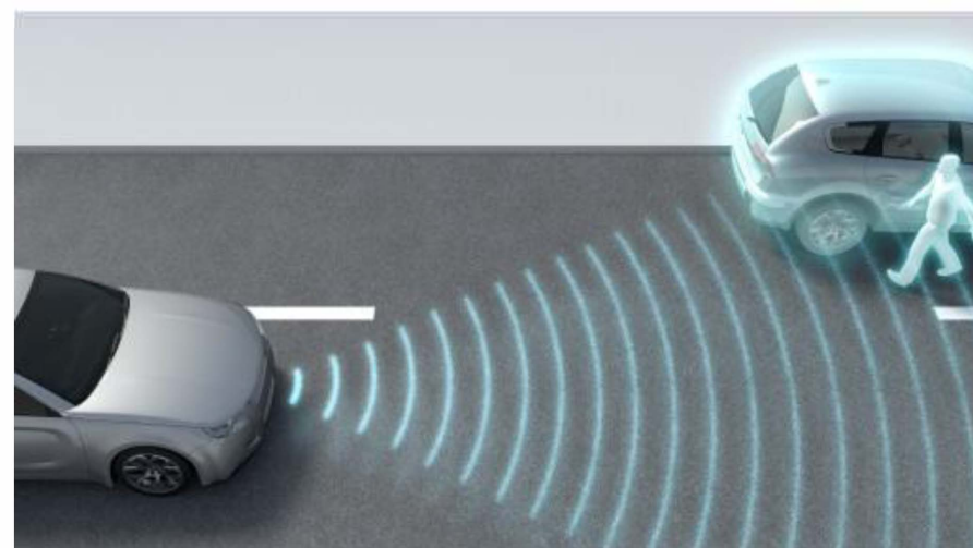
歩行者検知イメージ Detecting a pedestrian