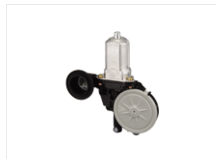
パワーウィンドモータ